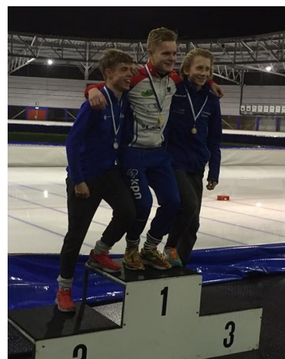
Sybrand op plek 2 bij de 500 meter

In Haarlem, waar de A-rijders aan de start stonden waren de omstandigheden omgedraaid en hadden de schaatsers juist meer tegenwind. Tijden vielen tegen, maar Joeri en Lois waren zeer tevreden, Lois werd zelfs 4de op de 1500m .